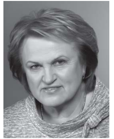
Pirmininkė Kazimira Danutė Prunskienė