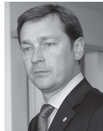
Pirmininkas Artūras Zuokas