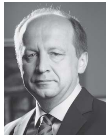
Pirmininkas Andrius Kubilius