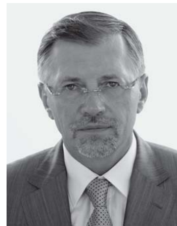
Pirmininkas Gediminas Kirkilas