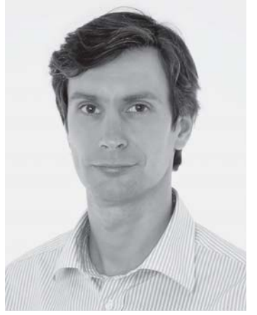
Pirmininkas Algirdas Paleckis