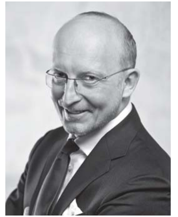
Pirmininkas Arūnas Valinskas