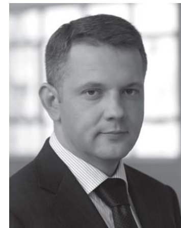
Pirmininkas Eligijus Masiulis