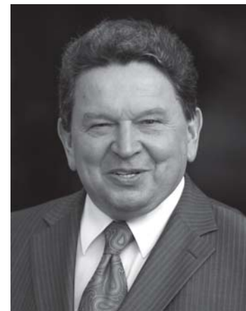
Pirmininkas Algimantas Matulevičius