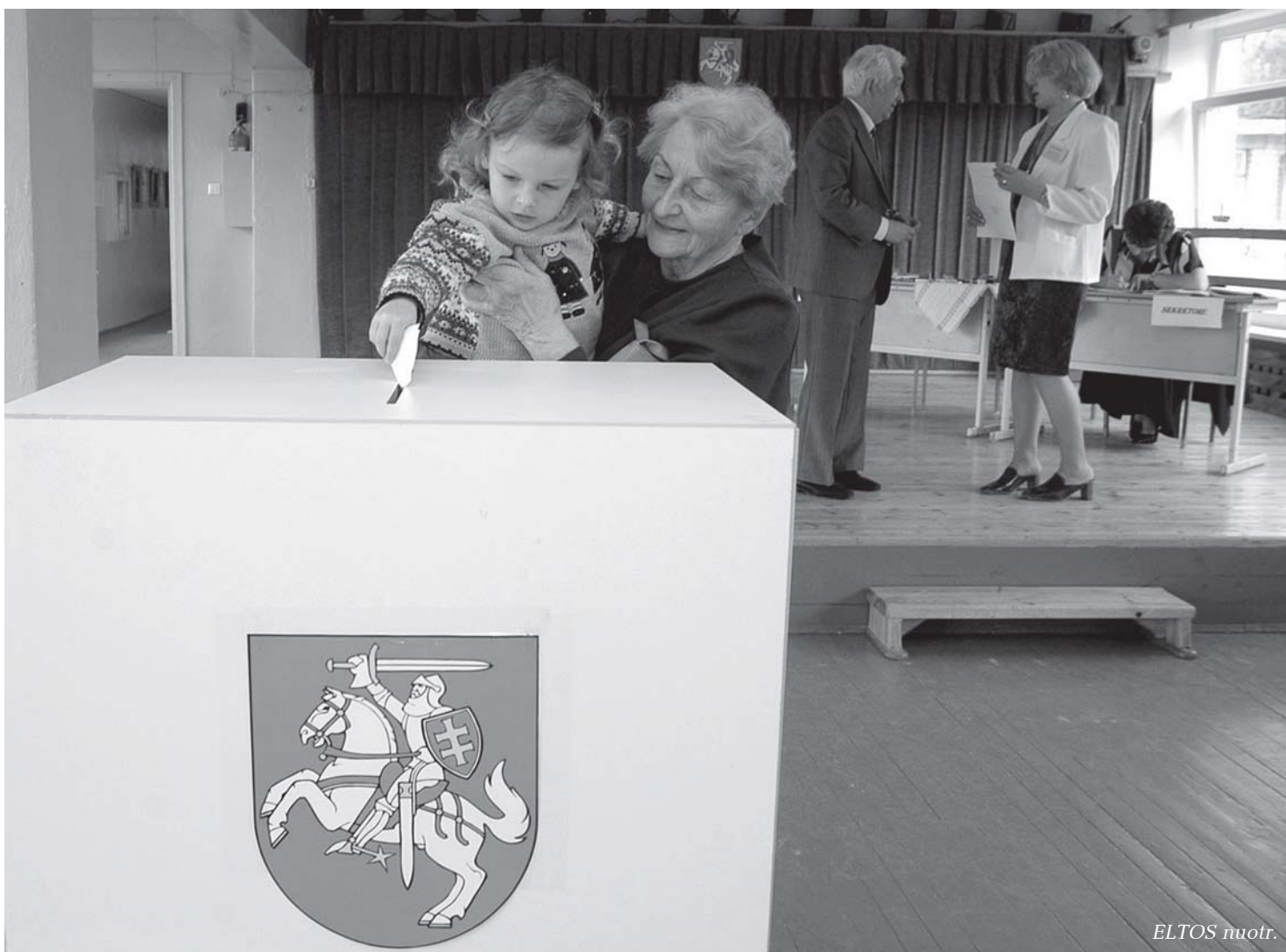
Prie rinkimų balsadėžės susitiks skirtingų kartų atstovai. Jų balsai lems, kurie politikai pasidalys 141 vietą Seime.