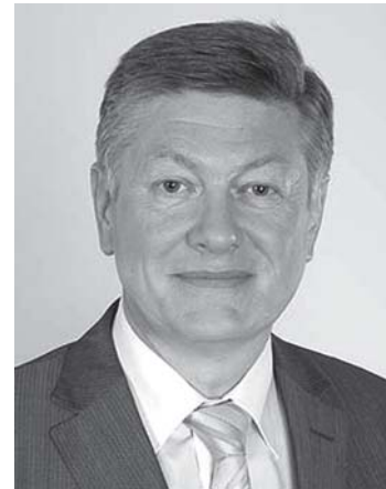
Pirmininkas Artūras Paulauskas