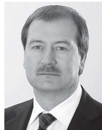
Pirmininkas Viktor Uspaskich