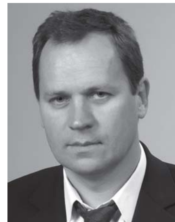
Pirmininkas Valdemar Tomaševski